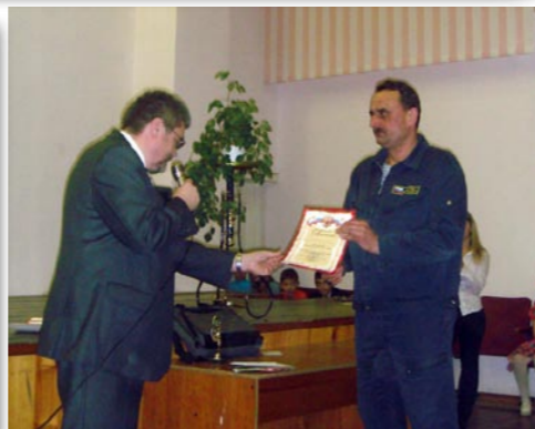
Торжественное награждение учителей и спортсменов